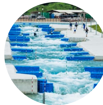
Parque Radical de Deodoro