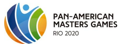
Pan-American Masters Games Rio de Janeiro - Brasil - 09/2020