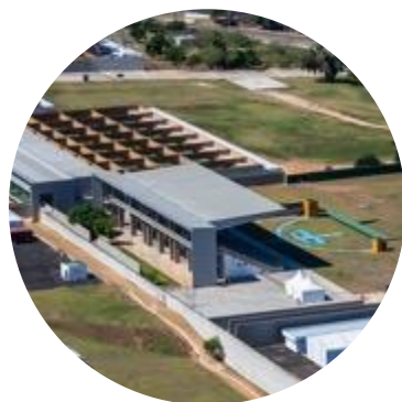
Cent. Nacional de Tiro