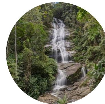
Floresta da Tijuca