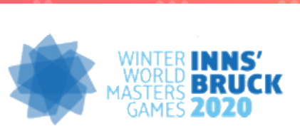
World Winter Masters Games Innsbruck - Áustria - 01/2020